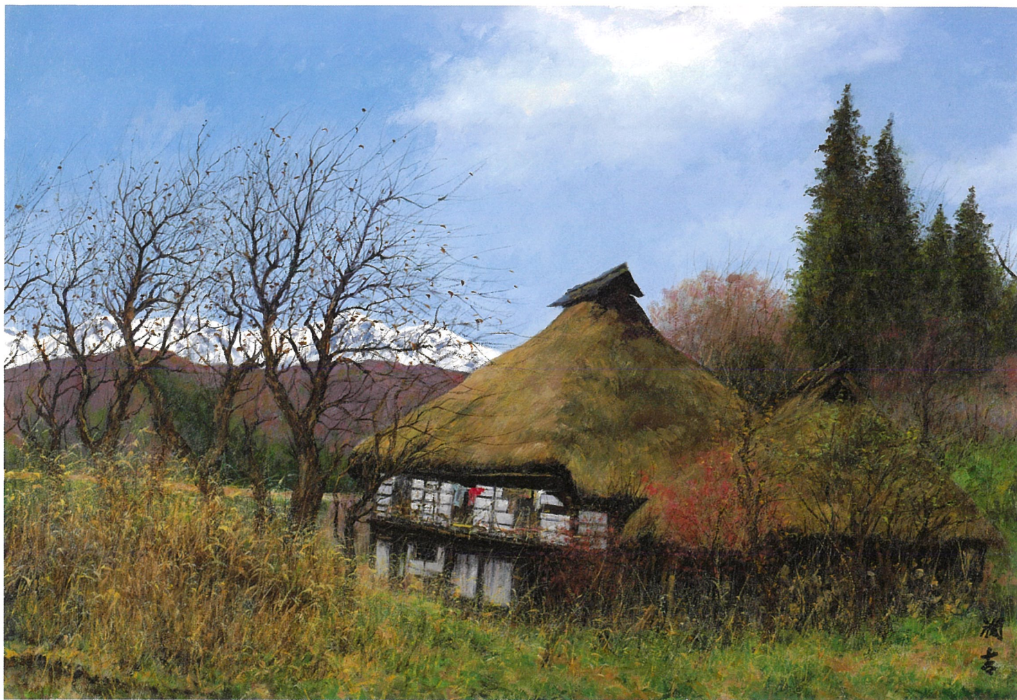
《運れる春の丘より》[長野県北安曇郡白馬村北城] 1986年