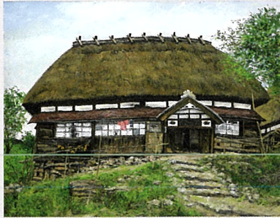
《マタギの家》〔秋田県北秋田郡阿仁町根子〕1963年

戦後40年にわたって、日本各地に残る伝統的な草屋根の民家を描きつづけた画家、向井潤吉(1901-1995)。その作品の多くは、向井が現地を訪ね、実際の民家を前に制作されたものです。