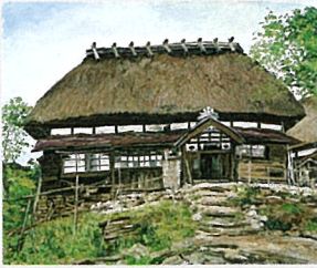
《マタギの家 根子部落にて》 〔秋田県北秋田郡阿仁町根子〕1963年