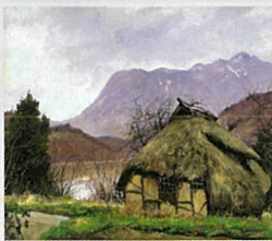
《雨後千曲川》 〔長野県下水内郡豊田村豊津路〕1977年