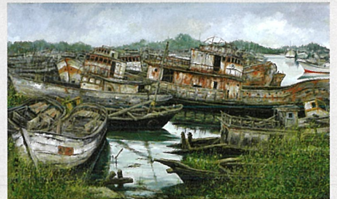
《一隅の風景》 〔茨城県東茨城郡大洗町〕1975年