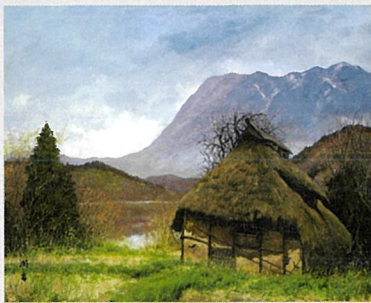
《雨後千曲川》 〔長野県下水内郡豊田村豊津路〕1977年