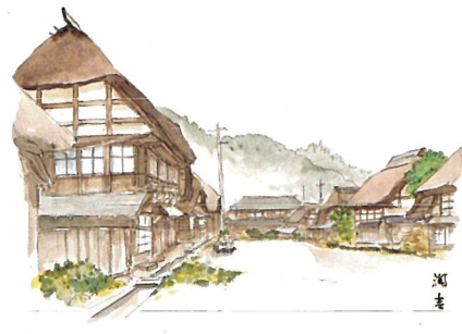
《道ばたの旅籠屋》【福島県郡山市湖南町三代】、1965年頃