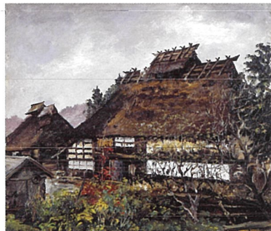
《山家雪意》【宮城県刈田郡七ヶ宿町間】、1961年