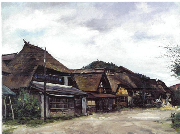
《御代宿初秋》【福島県郡山市湖南町三代】、1965年