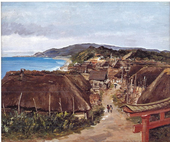
《北端の村》【青森県下北郡東通村尻屋、尻屋峠入口】、1962年