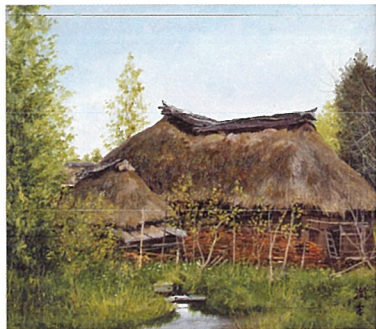
《水辺の曲り家》【岩手県花巻市大迫町内川目】、1976年