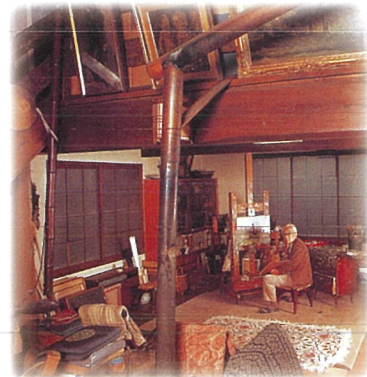
移築した土蔵(アトリエ)にて1975年頃

かつて向井潤吉のアトリエであり、住まいでもあった家屋を美術館とした当館のメインの展示室は、岩手県一関から移築した土蔵を改築したものです。遠い日に、岩手の地に根差していたこの空間で、民家に深い思いを抱いた画家の作品をお楽しみください。