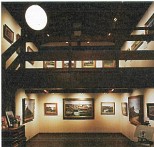
土蔵展示室