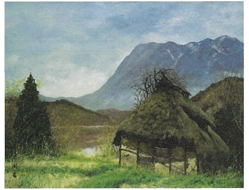
《雨後千曲川【長野県下水内郡豊田村豊津谷】》1977年