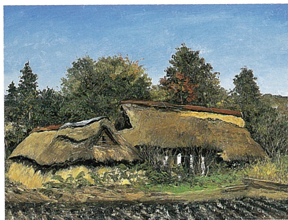
不詳(風景未完) 年代不詳

このたびの展覧会では、油彩、素描作品の数々を通じ、向井先生の描いた民家作品の魅力をご紹介します。