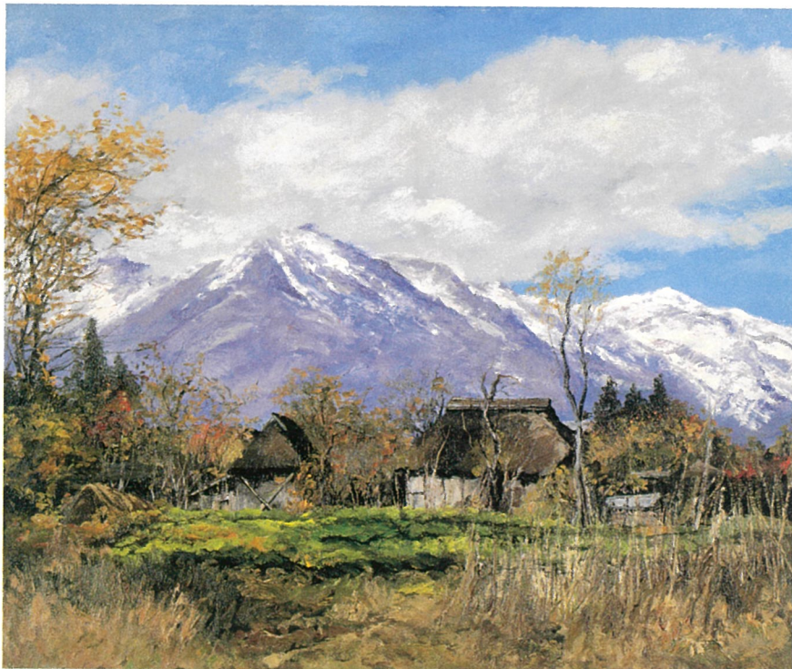
妙高高原(新潟県中頸城郡妙高高原町) 制作年代不詳

観覧料=一般200円(160円) 大高生150円(120円) 中小生100円(80円) 65歳以上及び障害者の方100円(80円) ( )内は20名以上の団体料金