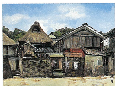
梅雨晴れの濱通り 年代不詳