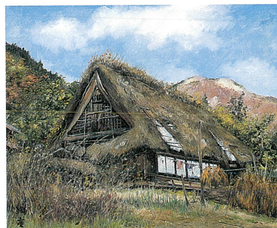
奥多摩の秋 年代不詳