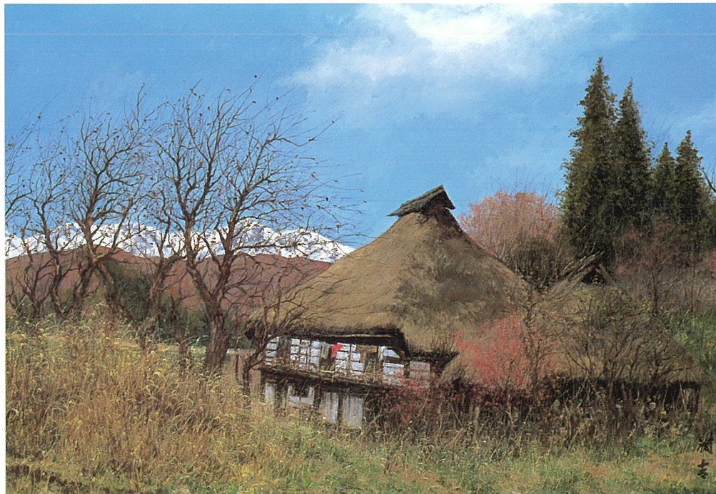
遅れる春の丘より(長野県北安曇郡白馬村北城) 1986年

春の息吹とともに、自然が生きてきた表情をたたえるこの季節、民家の姿もまた、美しい自然の景観と溶けあいながら、人が自然と共に生きていた懐かしい時を彷彿とさせることと思います。