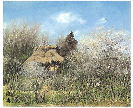
梅の中の家 制作年代不詳