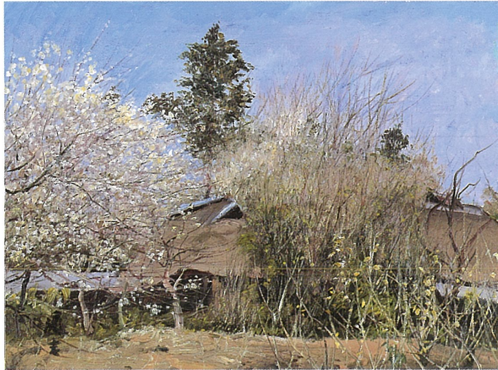
叢中の梅(埼玉県東松山市神戸) 1987年