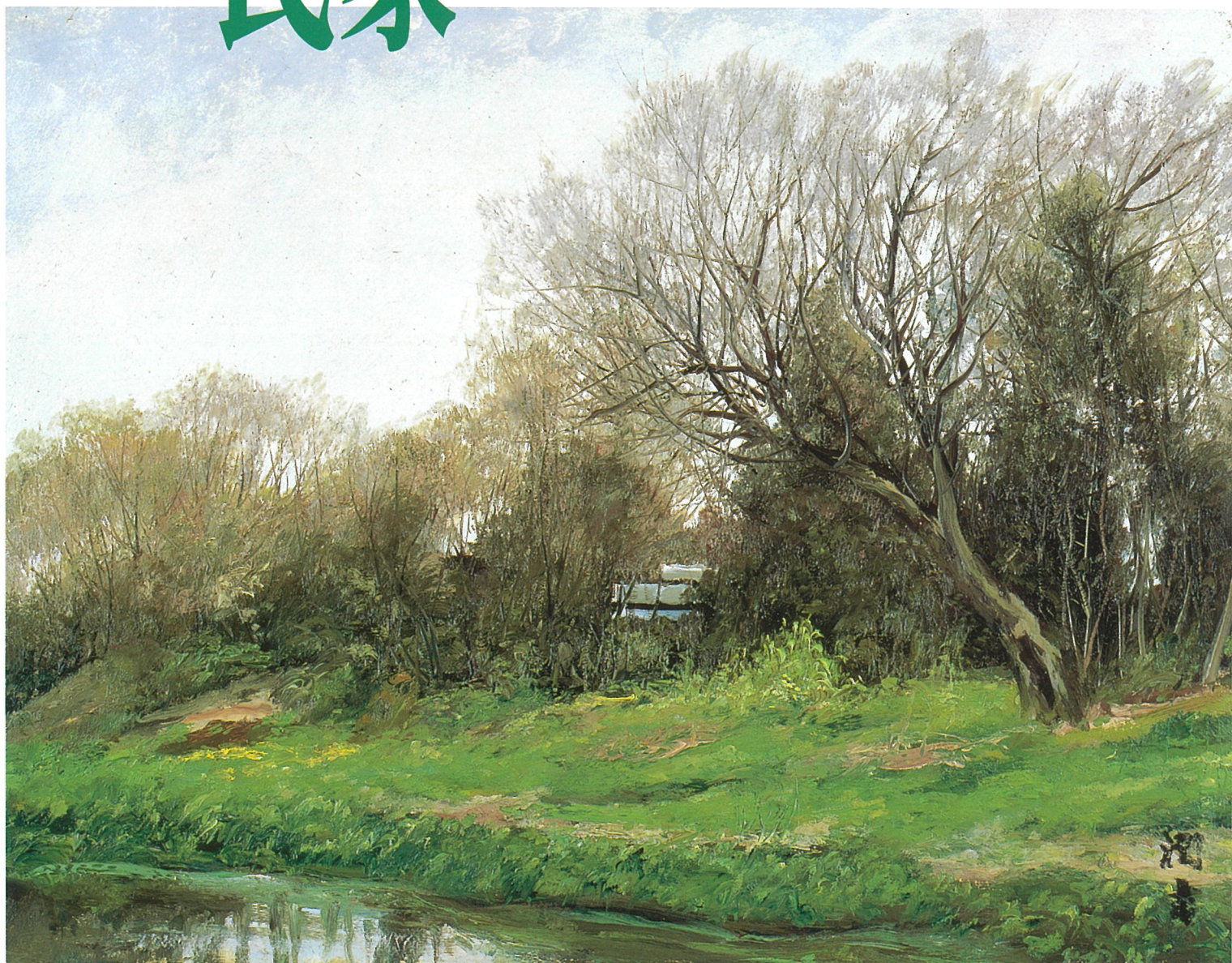
早春の水路（埼玉県川越市新河岸） 1982年