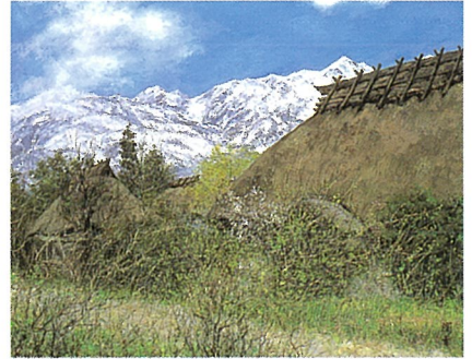
岳麓好日(長野県北信安曇郡白馬村塩島) 1969年