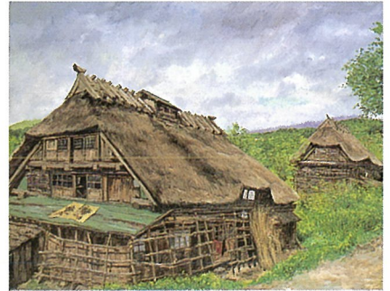
田麦俣にて(山形県東田川郡朝日村田麦俣) 1963年

向井潤吉先生の画業を代表する民家作品の数々は、多くの人々に親しまれております。民家をモチーフとしながらも、作品にはふんだんに自然の美しさが描きこまれており、その表現はきわめて優れた写実表現によって臨場感にあふれ、より一層、作品の魅力を高めているように感じられます。