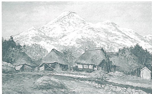
《白馬岳の見える丘》制作年代不詳