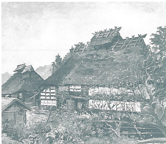
《山家雪意(宮城県刈田郡七ヶ宿町間字横川)》1961年