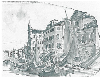
《ヨーロッパ風景(キオッジャ)》1960年