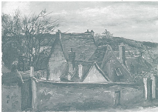
《プロバンの屋並》1958年

向井先生が長年にわたってモチーフとされてきた茅葺き屋根の民家と、歴史を経ても今なお生活の場となっているヨーロッパの石造りの民家をモチーフとした作品を同時にご覧いただきながら、私たちの日常と密接に関係する民家、風土、自然、生活など、いくつかの言葉が想起されればと思います。