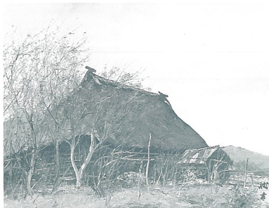
《沢内村六月(岩手県和賀郡沢内村)》1988年