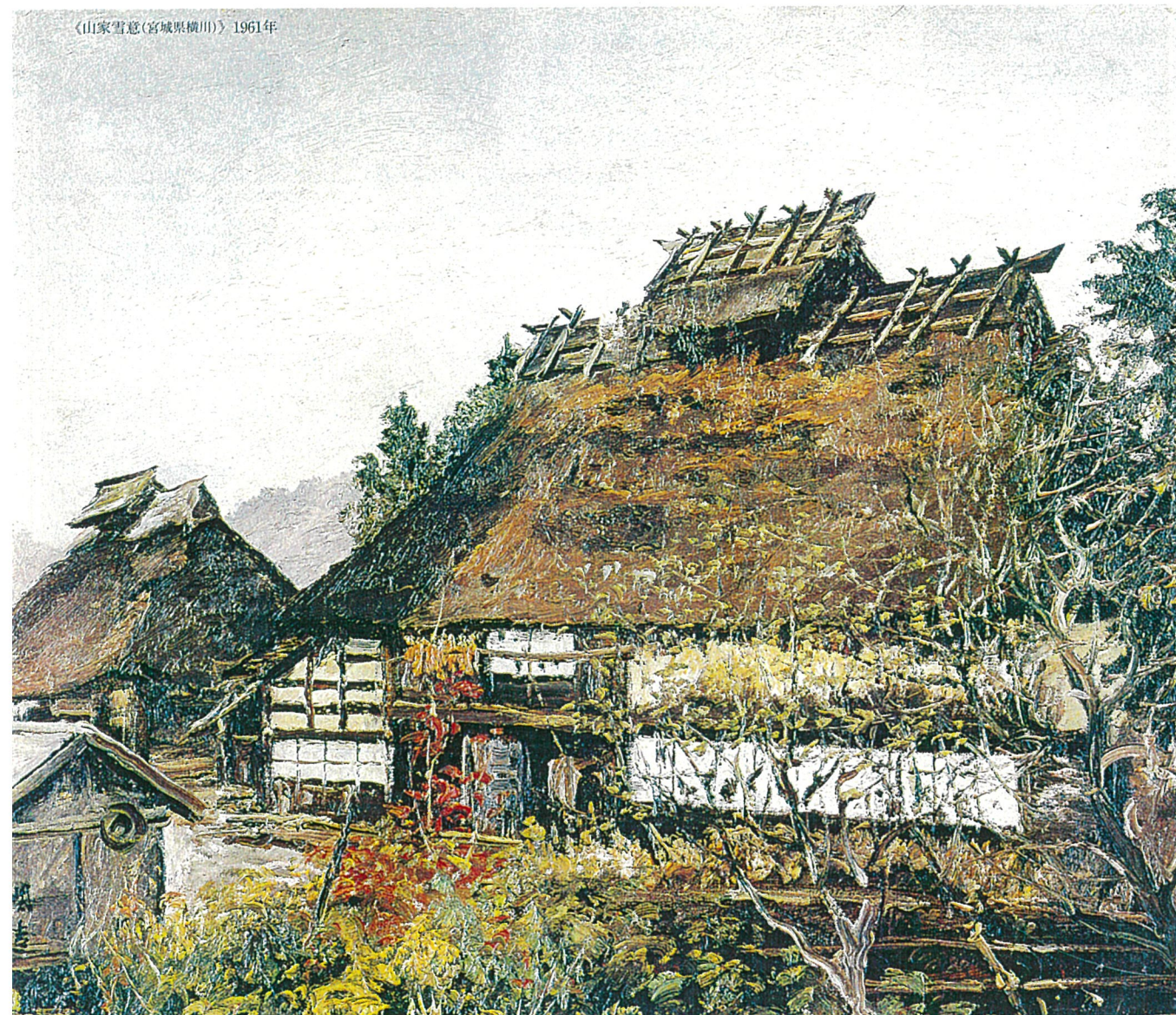
《山家雪意(宮城県横川)》1961年