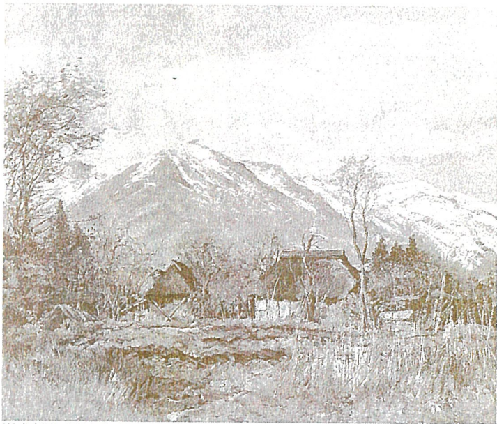
《妙高高原》制作年代不詳