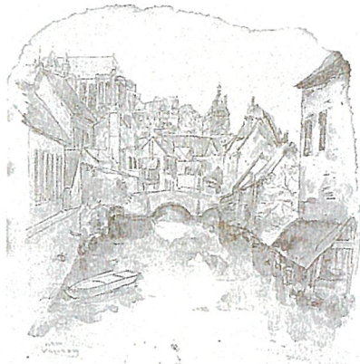
《ヨーロッパ風景(シャントルの小川)》1960年