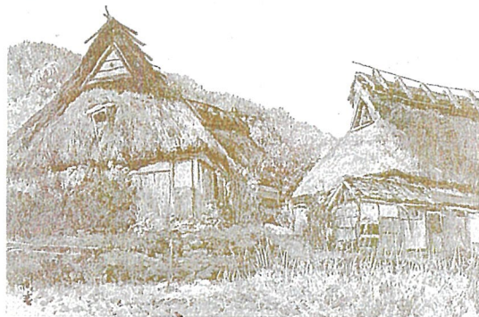
《丹波下山の部落(京都府船井郡丹波町下山)》1969年