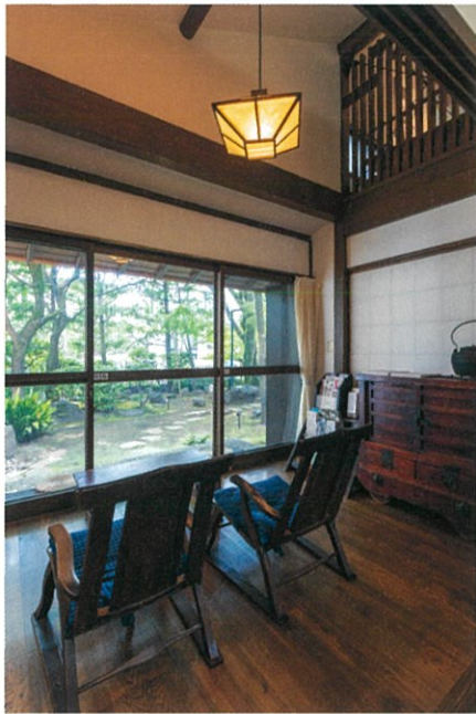
館内風景