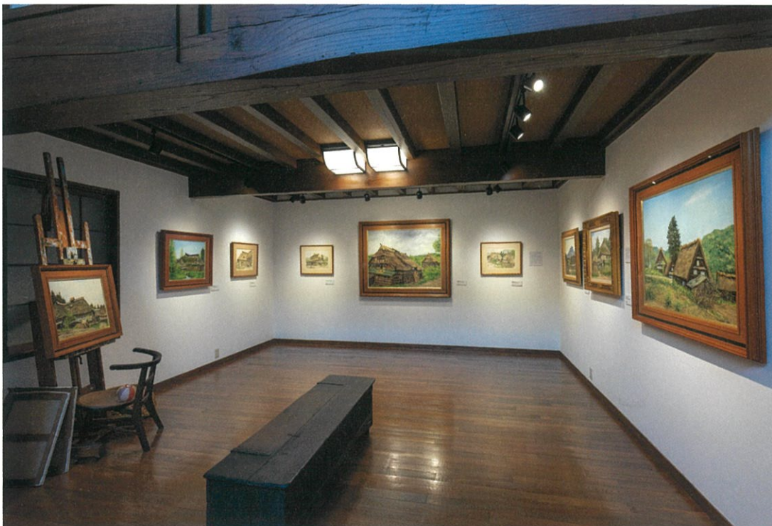
2018年度展示風景

〒154-0016 東京都世田谷区弦巻2-5-1 TEL.03-5450-9581 http://www.mukaijunkichi-annex.jp/